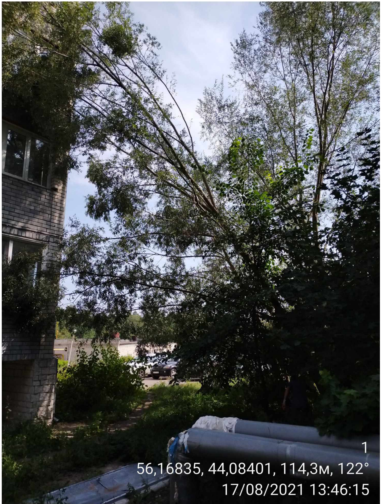
Дерево № 1